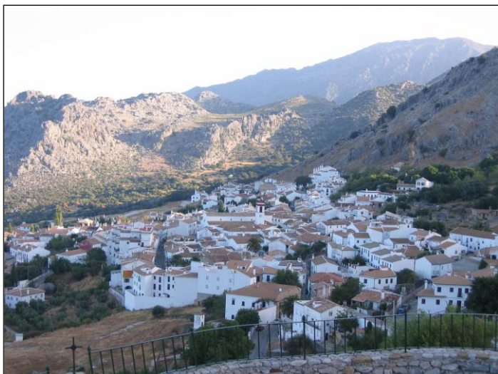
El pueblo Benaocaz está en las montañas