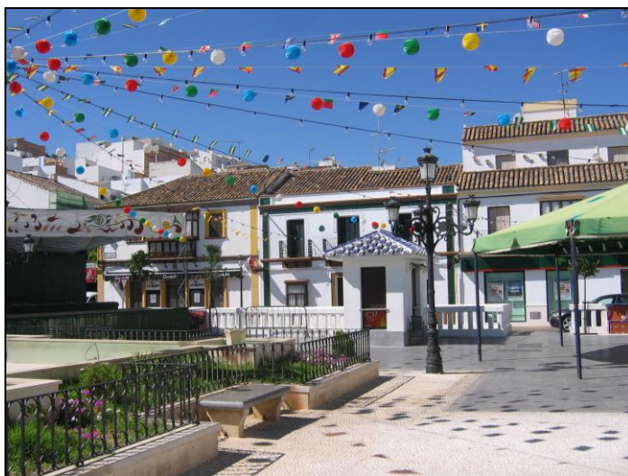
Decorado para la feria en Prado del Rey