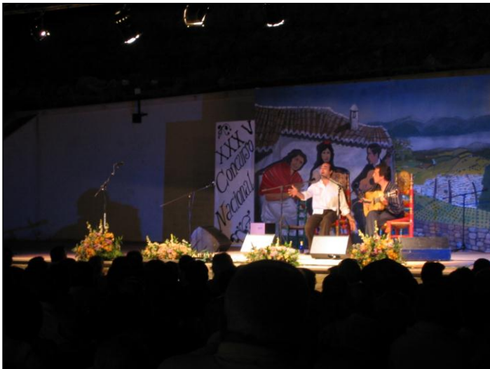
Un concierto de Flamenco